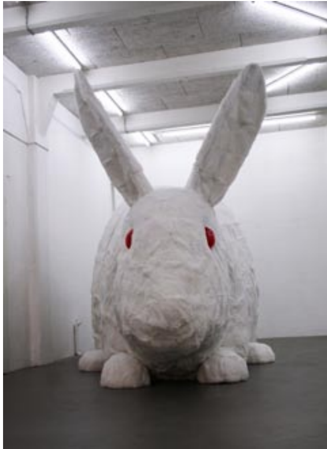
Great stuffed rabbit , 480 x 270 x 220 cm cm, bois, résine et fourrure de lapin, 2006.