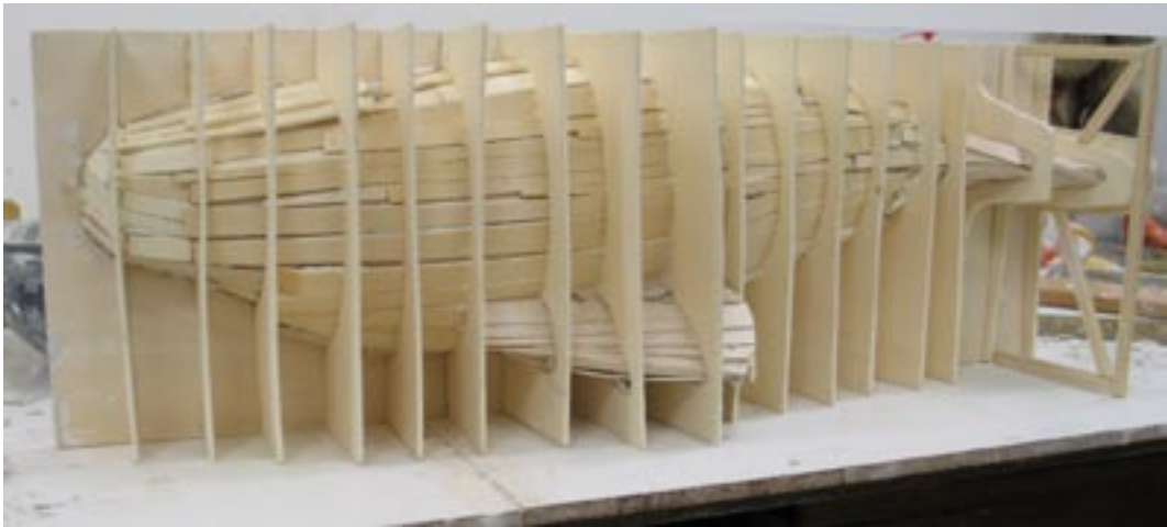
Etudes pour Hval .