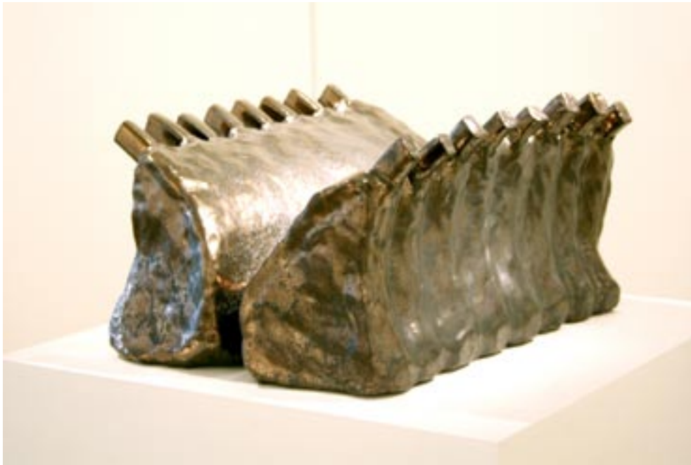
V 16, Côtelettes Sculpture, céramique émaillée, 2007.