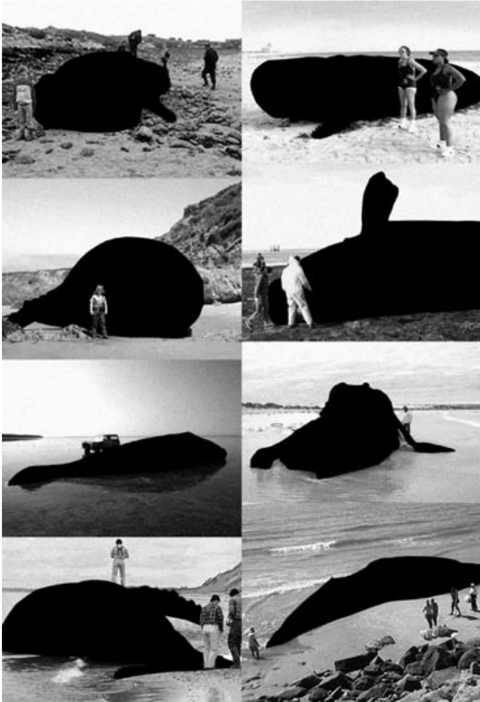
Extrait du document d'artiste Book of Hval .