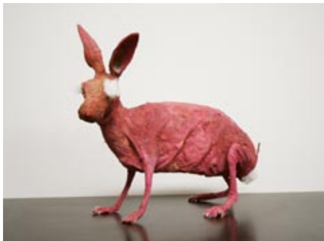
Lapin retourné , lapin taxidermisé inversé, 2007.