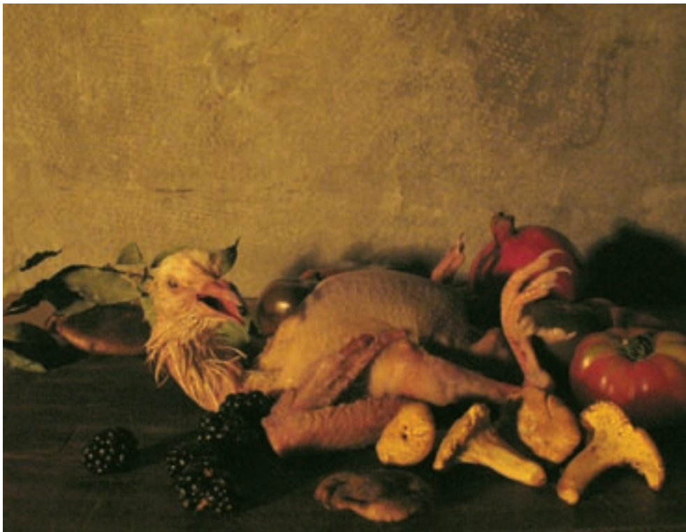
Still Live with Pigeon , image extraite de la vidéo, 2005.