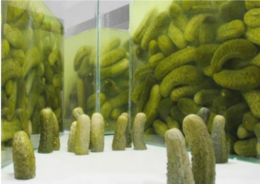
Histoire Naturelle (Gherkins!), image extraite de la vidéo, 2006.