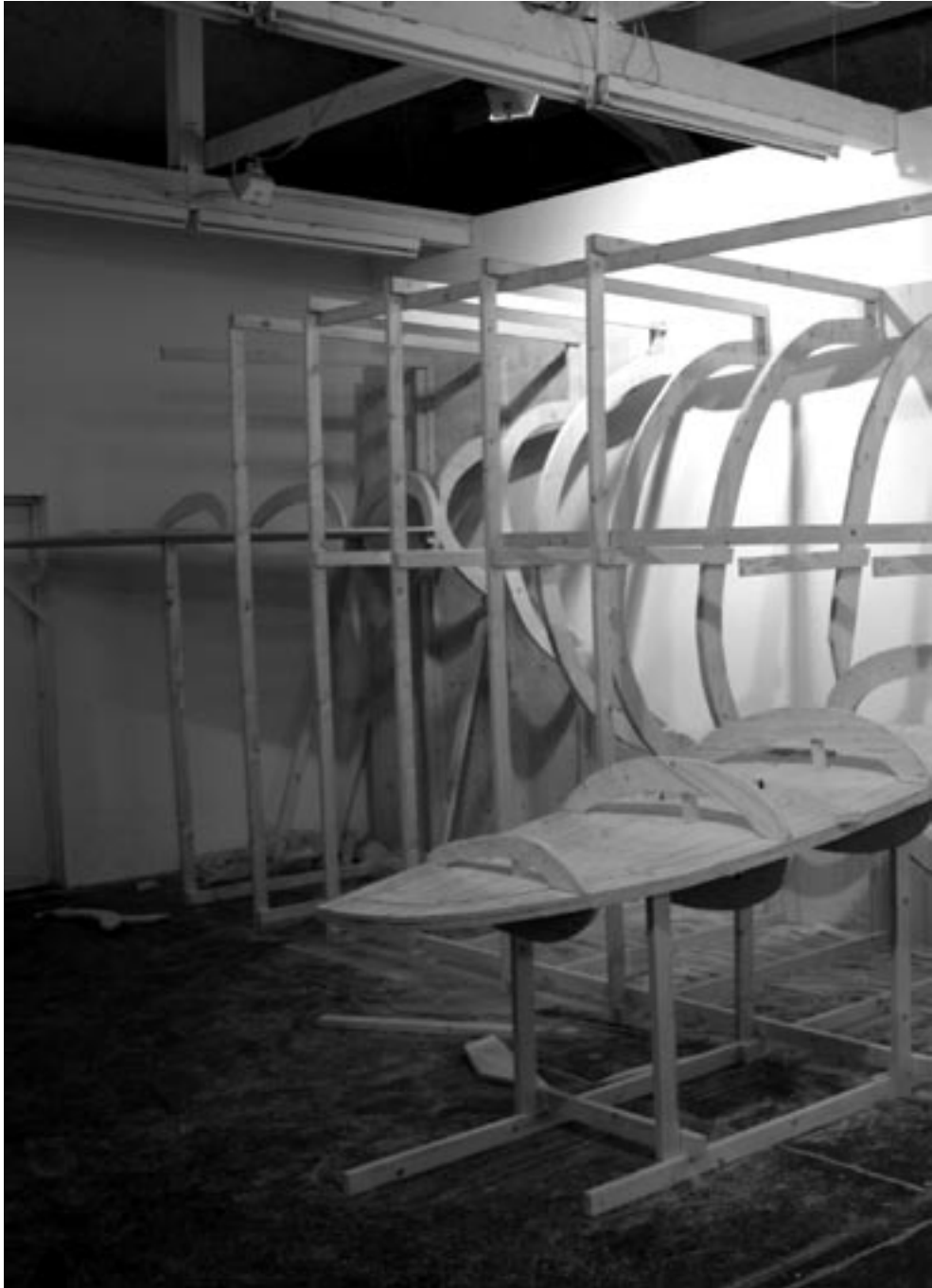
Extrait du document d'artiste Book of Hval .