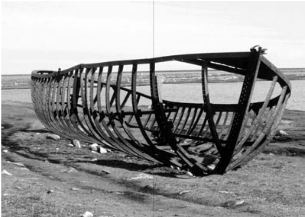
Extraits du document d'artiste Book of Hval .