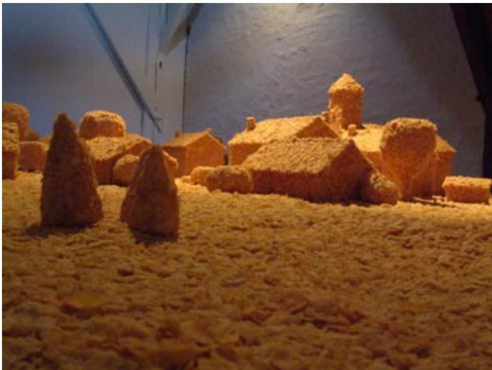
Flakes Town, village en Corn Flakes, env 500 x 500 x 60 cm, 2004.